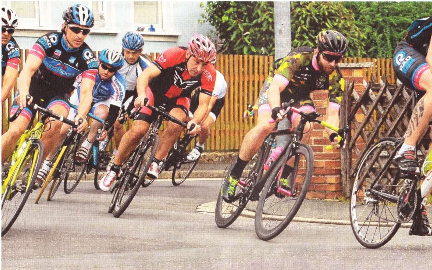
Die ständigen Punkte- und Prämiensprints machten das Rundstreckenrennen in Strullendorf (bei Bamberg) sehr schnell. Thiel ist hier an dritter Position im rot-schwarzen Dress zu sehen.